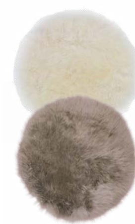
6. FELL-SITZAUFLAGE je 27,95

4. DEKO-WENDE-KISSEN: Noch was Schönes fürs Sofa oder auf der Suche nach einem besonderen Geschenk? Zum Glück gibt es dieses originelle Kissen. Vorne mit fröhlichen Pilzen, hinten hübsch kariert. Aus 100 % Baumwolle. Füllung aus 100 % Polyester. 45 / 45 cm 24,95. 5. NACKENSTÜTZKISSEN DORMABELL CERVICAL: Softiges, zweiteiliges Latexkissen zur perfekten Druckverteilung. Mit atmungsaktivem Bezugsstoff, durch Reißverschluss abnehmbar und bei 60 °C waschbar. Preisbeispiel: NB 4 129,95. 6. FELL-SITZAUFLAGE: Flauschig-warm aus 100 % Neuseeland-Schaffell. In drei schönen Natur-Farbtönen. Ø ca. 37 cm je 27,95. 7. DAMEN-SCHLAFANZUG: Reinschlüpfen und sich sofort wohlfühlen – der perfekte Begleiter durch die Nacht. In vier bezaubernden Dessins und kuschelweicher, hautfreundlicher Jersey-Qualität. Aus 100 % Baumwolle. Größen: S bis XL je 29,95.