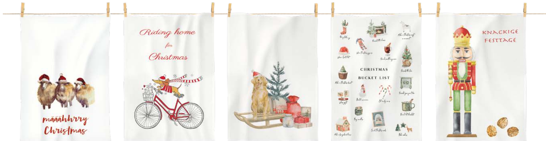
2. GESCHIRRTUCH je 5,95

1. KUSCHELFLANELL-BETTWÄSCHE: Natürlich gut schlafen, erfrischt und inspiriert aufwachen. Mit dieser Wohlfühl-Bettwäsche in freundlich-zartem Dessin geht das ganz leicht. Aus 100 % Baumwolle. Mit Reißverschluss. 135 / 200 cm 69,95, 155 / 200 cm 74,95, 155 / 220 cm 79,95. 2. GESCHIRRTUCH: Einfach mal Abwechslung in die Küche bringen. Mit fünf originellen Dessins und saugstarker Qualität. Aus 100 % Baumwolle. 50 / 70 cm je 5,95. 3. BIBER-BETTWÄSCHE: Neu interpretierte Karos in unvergleichlich flauschiger Biber-Qualität. Das ist der Stoff, aus dem traumhaft kuschelige Winternächte sind. Aus 100 % Baumwolle. Mit Reißverschluss. 135 / 200 cm 49,95, 155 / 200 cm 59,95, 155 / 220 cm 69,95.