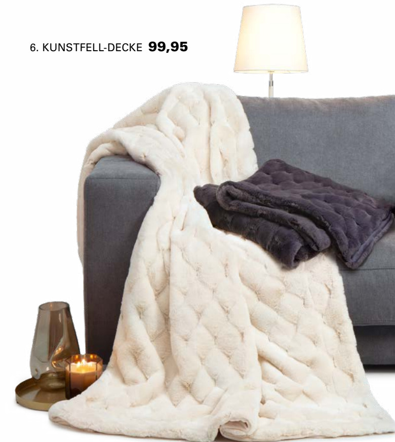
6. KUNSTFELL-DECKE 99,95

4. SPANNBETTUCH PREMIUM: Sanfter, faltenfreier Luxus in 40 Farben, formbeständig und ganz einfach zu beziehen. Aus 95 % Baumwollzwirn und 5 % Elasthan. 90 / 190 – 100 / 220 cm 54,95, 140 / 200 – 160 / 220 cm 79,95, 180 / 200 – 200 / 220 cm 99,95. 5. INTERLOCK-JERSEY-BETTWÄSCHE: Kunstvoll inszenierte Ginkgo-Blätter auf besonders weichem, geschmeidigem Jersey. Das ist der Mix, der traumhaft entspannte Nächte macht. Aus 100 % Baumwolle. Mit Reißverschluss. 135 / 200 cm 109,-, 155 / 200 cm 129,-, 155 / 220 cm 139,-. 6. KUNSTFELL-DECKE: Flauschig warm und ganz schön dekorativ. Die Wohlfühldecke in zwei natürlichen Farben und mit auffälliger Rhombus-Struktur. Aus 100 % Polyester. 150 / 200 cm 99,95.