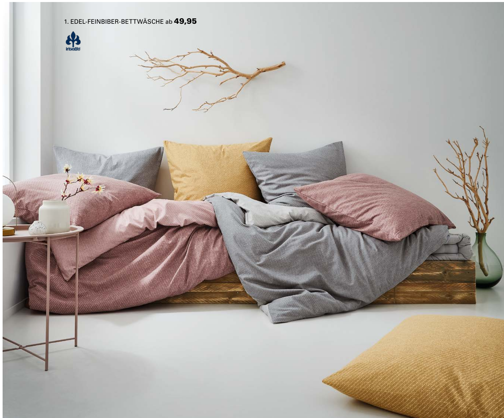
1. EDEL-FEINBIBER-BETTWÄSCHE ab 49,95