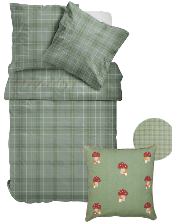
4. DEKO-WENDE-KISSEN 24,95