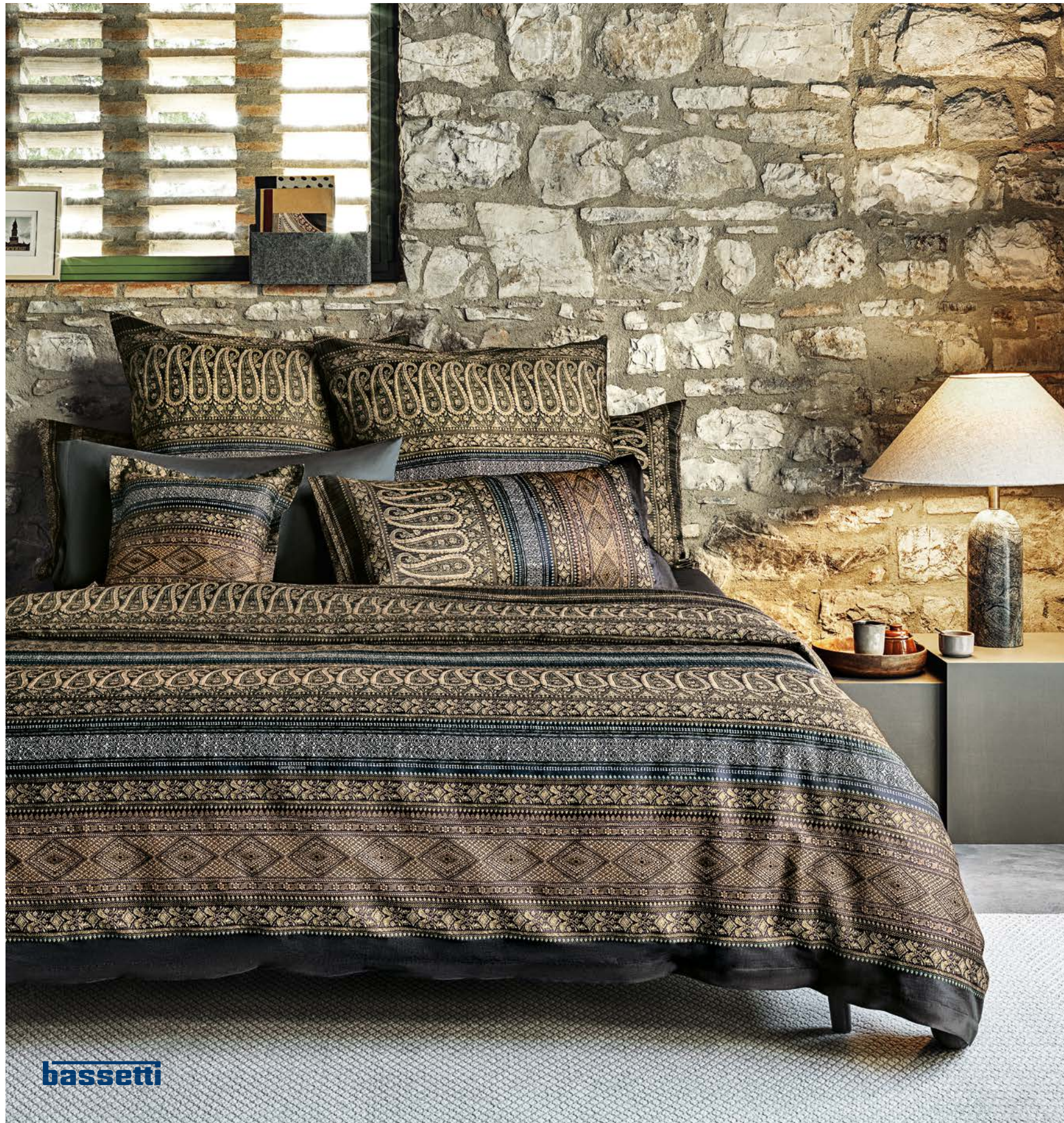
1. SATIN-BETTWÄSCHE ab 109,-