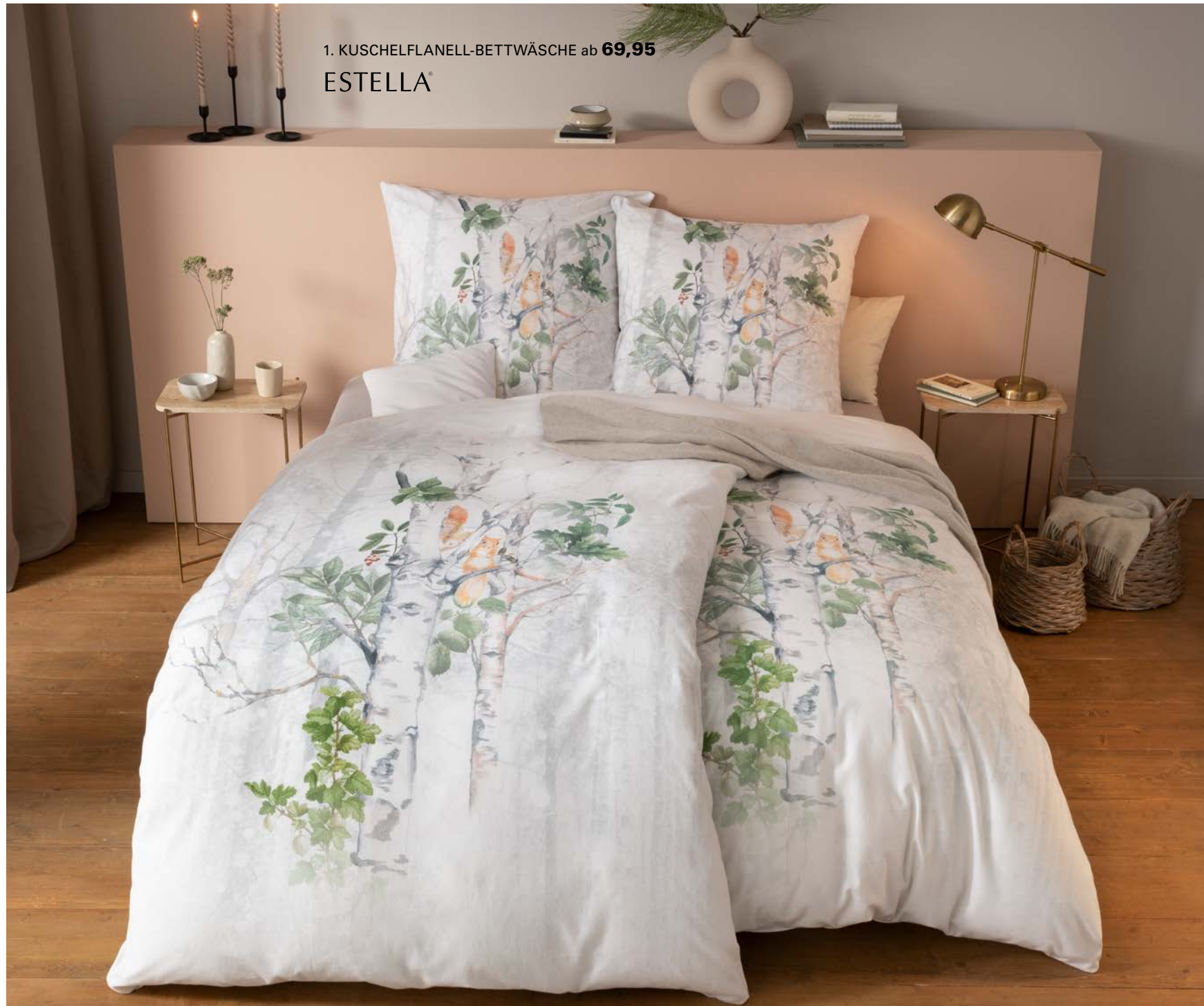
1. KUSCHELFLANELL-BETTWÄSCHE ab 69,95 ESTELLA®