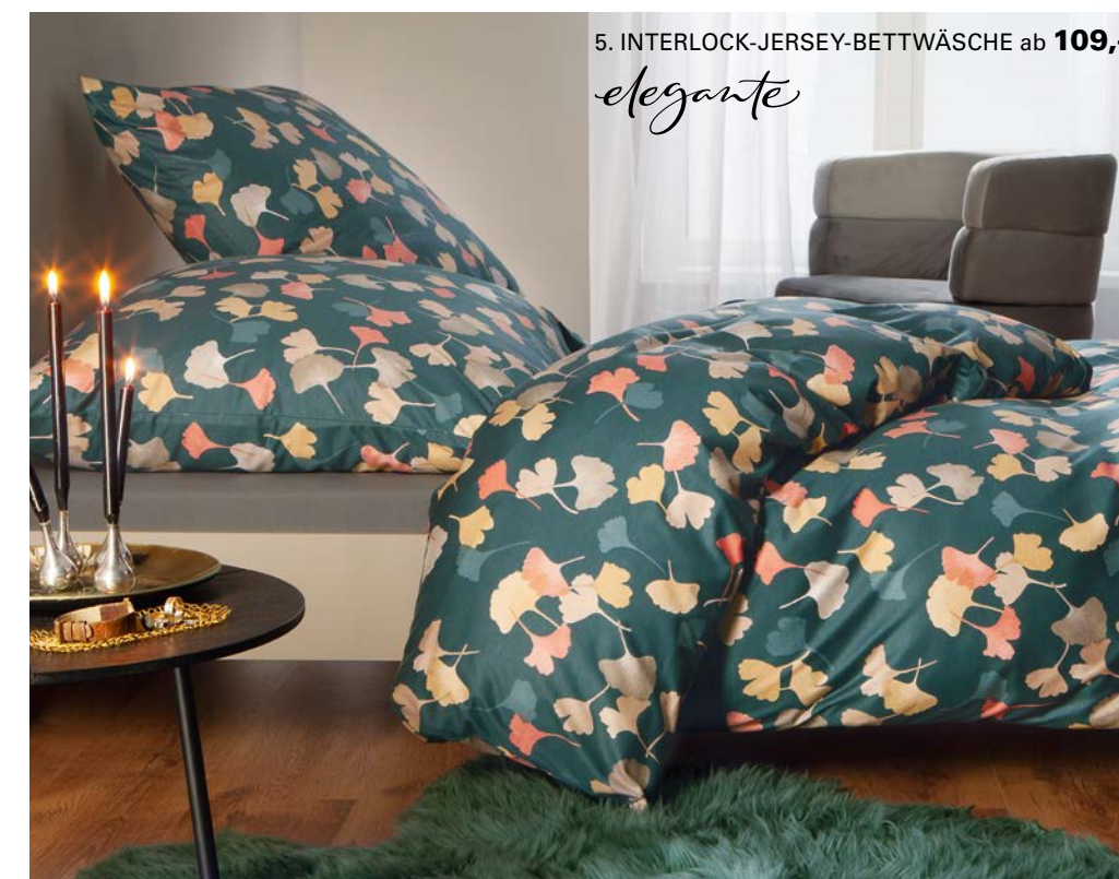
5. INTERLOCK-JERSEY-BETTWÄSCHE ab 109,-

„ UNSER TREND-TIPP: STIMMEN SIE DAS SPANNBETT- TUCH PERFECT AUF DIE BETTWÄ- SCHE AB. SIE HABEN DIE WAHL ZWISCHEN 40 FARBEN. „