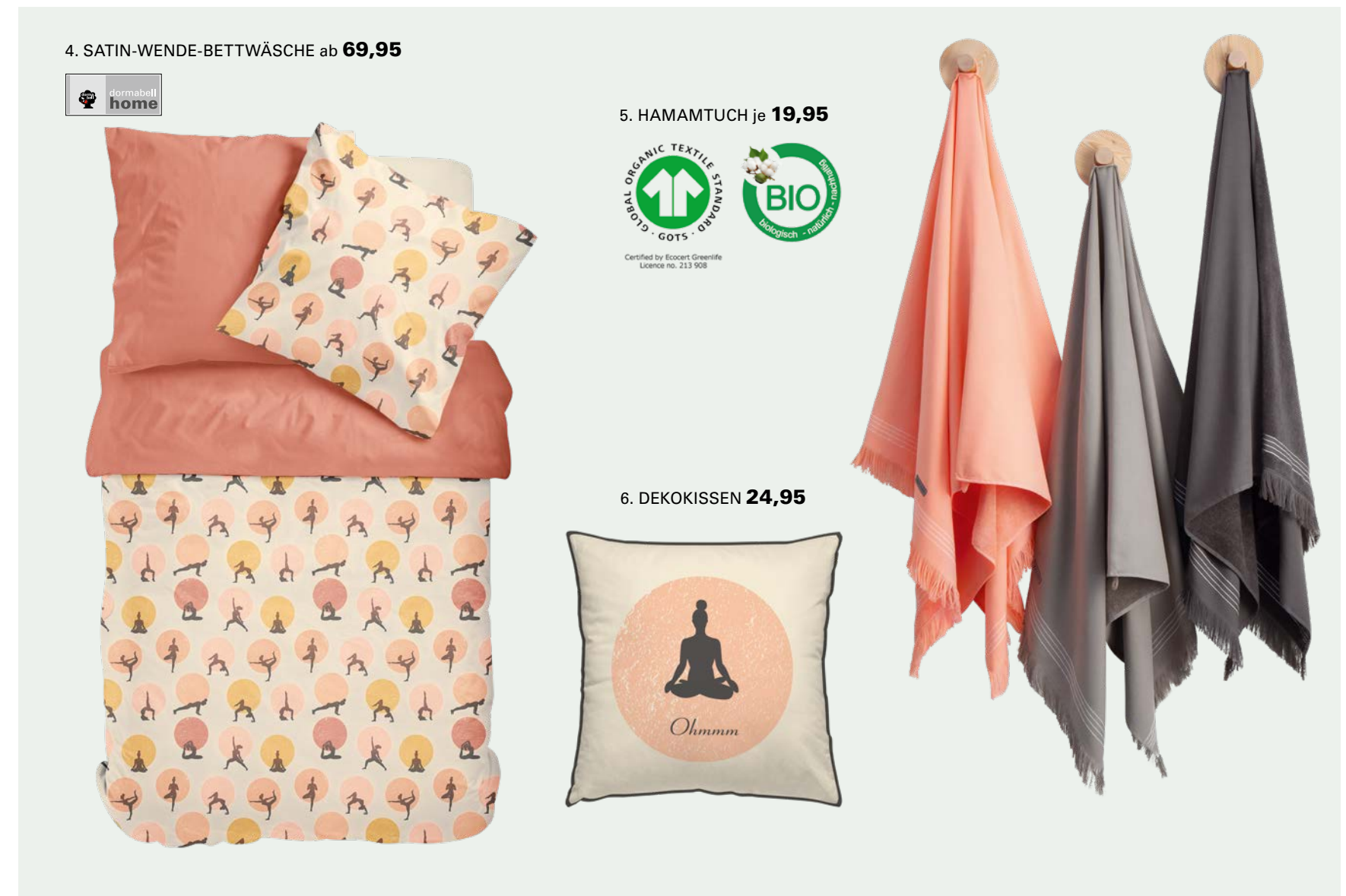
4. SATIN-WENDE-BETTWÄSCHE ab 69,95

1. EDEL-FEINBIBER-BETTWÄSCHE: Beruhigend fürs Auge, wärmend und weich für erholsamen Schlaf. Die schönste Einladung zum Kuschneln, erhältlich in drei zauberhaft zarten Uni-Farbtönen. Aus 100 % Baumwolle. Mit Reißverschluss. 135 / 200 cm 49,95, 155 / 200 cm 59,95, 155 / 220 cm 69,95. 2. KUSCHELSTOCKEN: Wohlfühlen beginnt bei warmen Füßen. Und für die passende Optik gibt es süße Bommel und verspielte, natürliche Dessins. Aus 98 % Polyester und 2 % Elasthan. One Size je 9,95. 3. FROTTIER DORMABELL SPA: Hochwertige, hautfreundliche Frottierqualität. Besonders saugfähig und dauerhaft kuschelweich. Aus 100 % Baumwolle. 50 / 100 cm 11,95, 70 / 140 cm 24,95, 76 / 200 cm 32,95. 4. SATIN-WENDE-BETTWÄSCHE: Die Sonne geht unter und die Entspannung beginnt. Was das originelle Yoga-Dessin schon andeutet, macht hochwertiger, geschmeidiger Satin perfekt. Aus 100 % Baumwolle. Mit Reißverschluss. 135 / 200 cm 69,95, 155 / 200 cm 79,95, 155 / 220 cm 89,95.