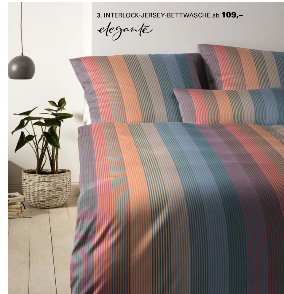
3. INTERLOCK-JERSEY-BETTWÄSCHE ab 109,-